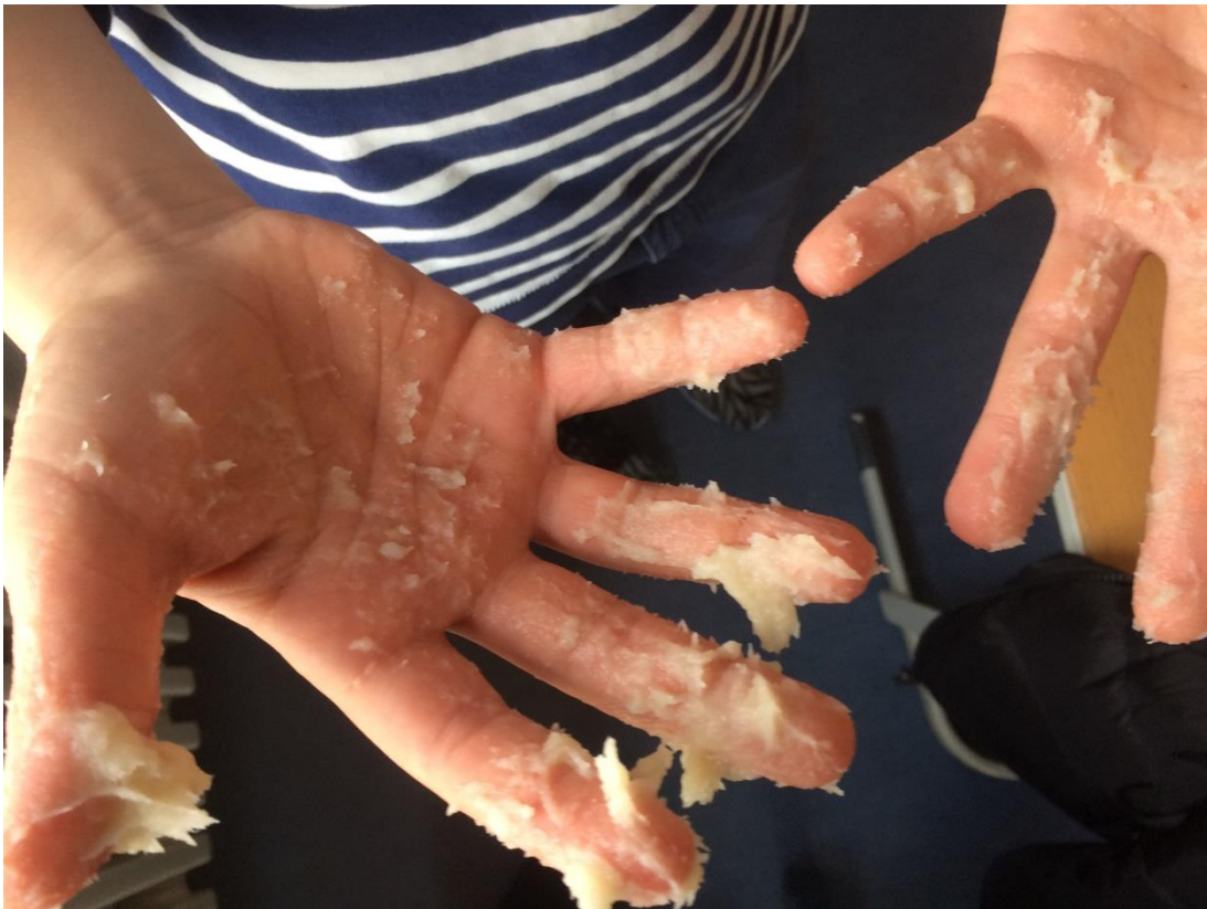
Das war die klebrige Knete 1.

Da der Widerstand beim Messen nicht konstant war, sind die oben aufgezählten Werte nur Annäherungswerte.