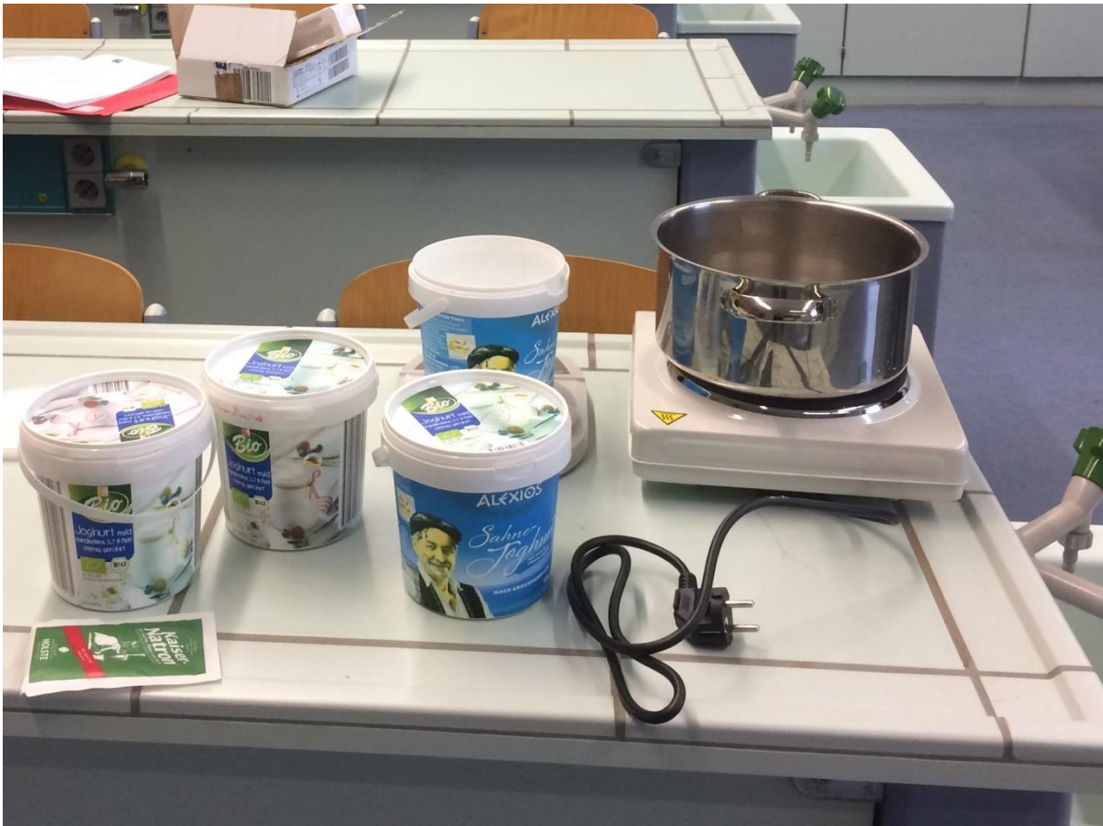
Das war unser Kochtisch.

Die Idee hatten wir im Forscherclub, eine Arbeitsgemeinschaft an unserer Schule, in deren Rahmen wir überhaupt an Jugend Forscht bzw. Schüler experimentieren teilnehmen. Uns hat blendend interessiert, ob man z.B. eine offene Stelle an unseren geliebten Handyladekabeln und gar 2 Kabelstücken einfach mit ein bisschen Knete zusammenfügen kann und diese so wieder leitend zu machen. Und dass man Modelle diverser Sachen aus der Knete bauen könnte und an diesen dann Lämpchen zu befestigen, damit diese leuchten; Ein beleuchteter Weihnachtsbaum aus Knete! Das führte uns dann zu der Idee, dies bei Schüler experimentieren als Thema zum Erforschen zu wählen.