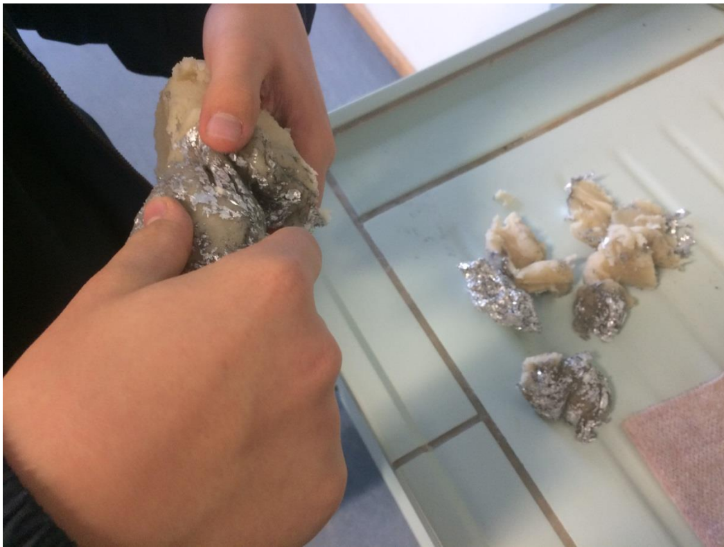
Die Zitronensäure in der Knete 3 Reagierte mit der Alufolie.