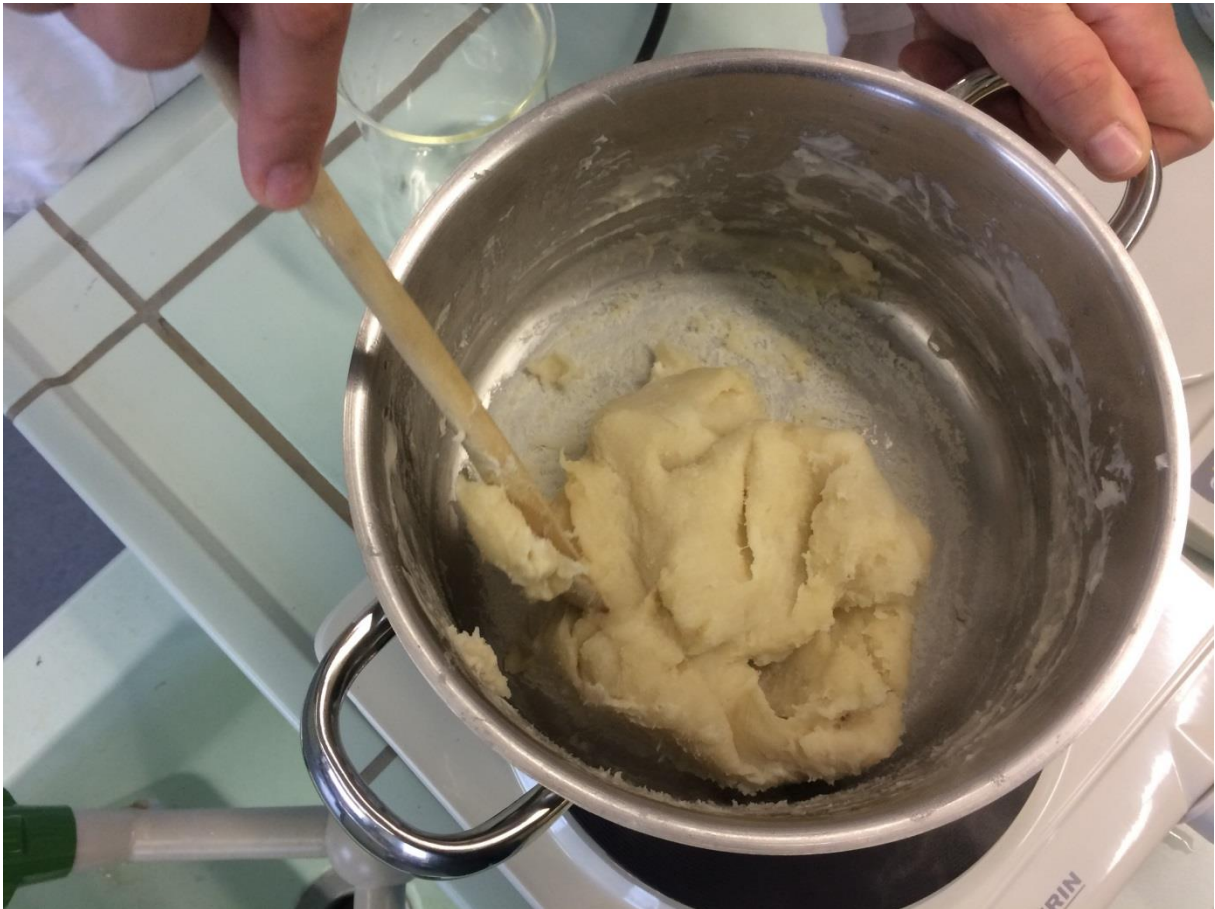
...doch plötzlich formte sich ein fester Ball.