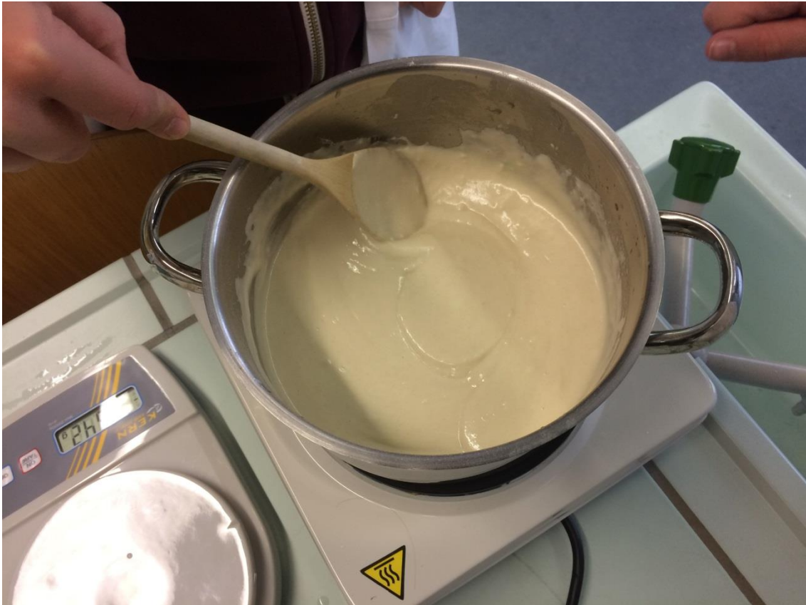
Die Knete war als erstes flüssig...